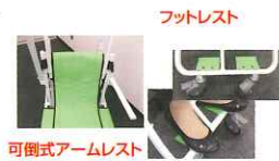
可倒式アームレスト